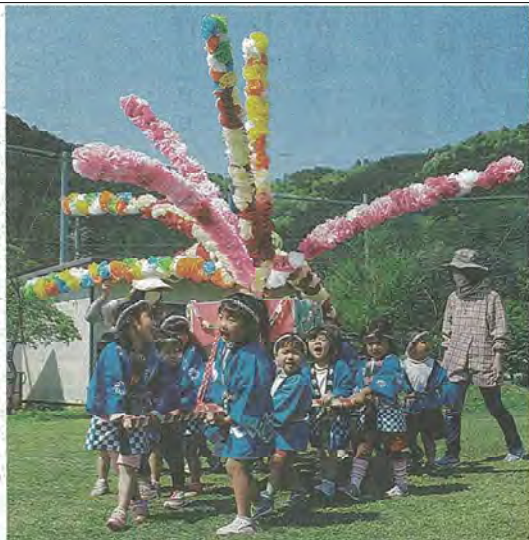
豪華な花を付けた手作りみこしを担ぐ園児ら。美濃市長瀬の下牧こども園で

美濃のこども園 手作りみこし担ぐ 美濃市長瀬の下牧こども園で二十日、園児二十八人、園庭を練り歩いた。